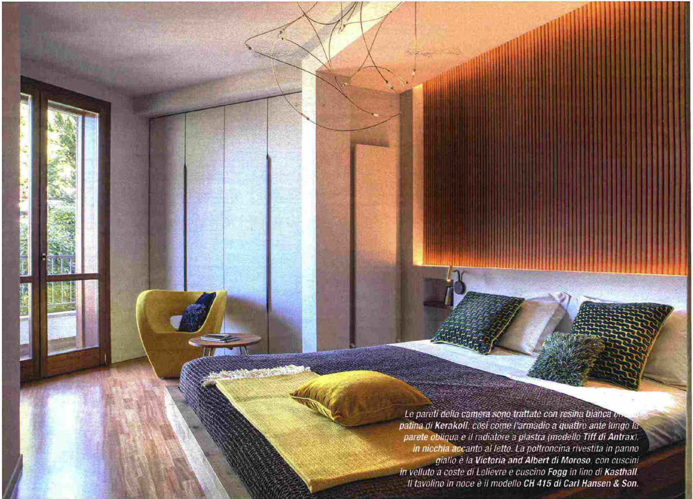
Le pareti della camera sono trattate con resina bianca e patina di Kerakoll, così come l'armadio a quattro ante lungo la parete obliqua e il radiatore a piastra (modello Tiff di Antrax), in nicchia accanto al letto. La poltroncina rivestita in panno giallo è la Victoria and Albert di Moroso, con cuscini in velluto a coste di Lelievre e cuscino Fogg in lino di Kasthall. Il tavolino in noce è il modello CH 415 di Carl Hansen & Son.